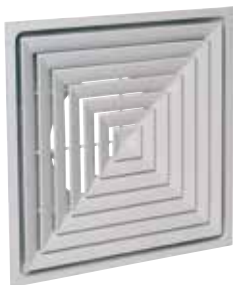
SF704RIF(5) F16 D315 (AxB=600x600)

Le SF 704 R TP est un diffuseur carré plafonnier avec 4 directions de soufflage avec plénum intégré pour la diffusion d'air dans les locaux tertiaires.