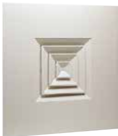
Diffuseur SF 704TP

Le SF 704 TP est un diffuseur carré pour dalle de plafond avec 4 directions de soufflage pour la diffusion d'air dans les locaux tertiaires.