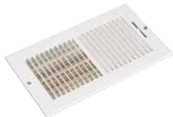
SR 356 F1 254X152

La grille murale emboutie SR 356 permet le soufflage d'air dans un local. Elle est munie d'un registre pour pouvoir régler le débit d'air.