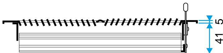
Grille SR 356