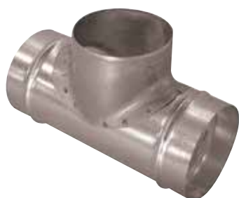
Té Equerre 90° en aluminium

Le TE 90° alu permet de raccorder deux branches de réseau aluminium avec un angle de 90°.