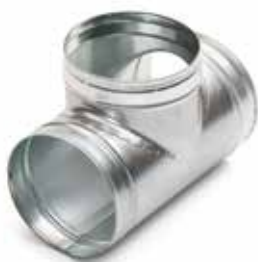
Té Equerre 90°

Le TE 90° permet de raccorder deux branches de réseau galvanisé avec un angle de 90°.