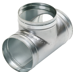
Té Equerre 90°

Le TE 90° permet de raccorder deux branches de réseau galvanisé avec un angle de 90°.