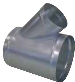
Té Oblique 45°

Le TE 45° permet de raccorder deux branches de réseau galvanisé avec un angle de 45°.