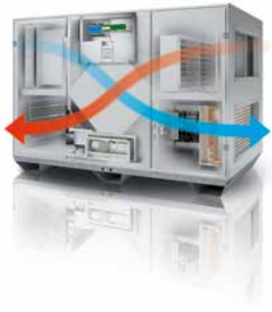
Visualisation des flux d'air au sein d'une VEX500