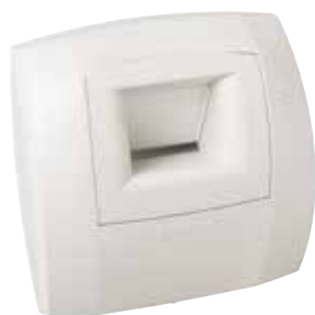
Bahia Curve sanitaire

La bouche BAHIA CURVE S est une bouche hygroréglable à destination des sanitaires (Salle de bain et WC) permettant de garantir l'extraction suffisante et permanente des pollutions intérieures en fonction du taux d'humidité dans la pièce.